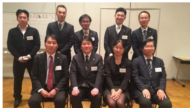
北支部から参加した相談員