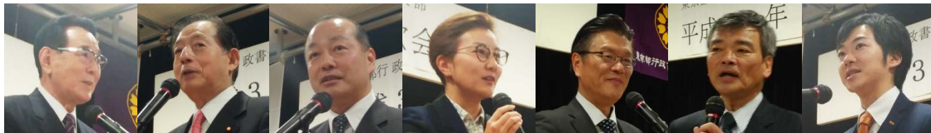
左から、花川與惣太区長、太田昭宏衆議院議員、高木けい衆議院議員、池内さおり前衆議院議員、大松あきら都議会議員、曾根はじめ都議会議員、おときた駿都議会議員（ほか多数のご来賓の皆様にお越しいただきました）