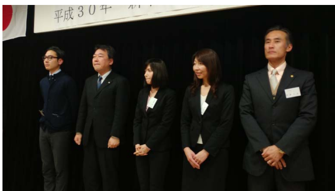
新入・転入会員のご紹介