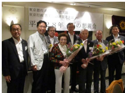
宮内名誉会長、村田・須藤両相談役へ花束が贈呈されました。