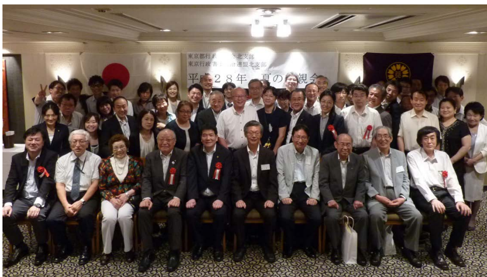
参加者全員で記念撮影。今年も大盛会となりました！